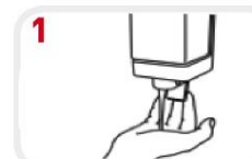
1 Neem een voldoende hoeveelheid zeep