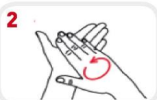
2 Wrijf de handpalmen tegen elkaar