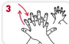
3 Wrijf de rechter handpalm over de linker handrug en omgekeerd