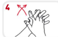
4 Wrijf de rechter handpalm tegen de linker handpalm met de vingers van beide handen tussen elkaar