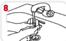
8 Spoel de handen goed af zodat alle zeepresten verwijderd worden