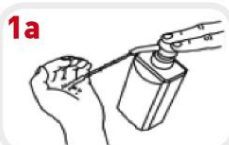
1a Neem een handvol handalcohol (ongeveer 3 ml)